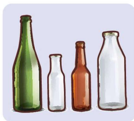
Limbah Wadah Kaca

Harap memilah untuk didaur ulang karena bisa jadi membahayakan petugas pengumpul barang daur ulang