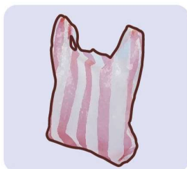
Kantong Plastik Sampah Bersih

Harap didaur ulang secara terpisah karena barang harus sangat bersih supaya dapat dimanfaatkan kembali