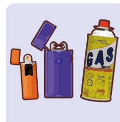
Bahan Mudah Terbakar (korek api, kaleng gas, puntung rokok)

Berdasarkan Pengumuman Kota New Taipei No. 1121752310 pada tanggal 12 September 2023, bagi yang tidak memisahkan sampah daur ulang akan