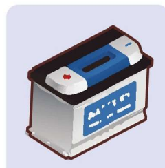
Limbah Baterai Timbal-Asam