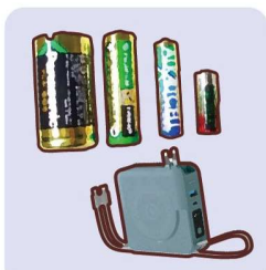
Limbah Baterai Kering Power Bank (Limbah Baterai Lithium)

Harap daur ulang secara terpisah karena mudah terbakar