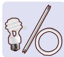
Limbah Sumber Penerangan